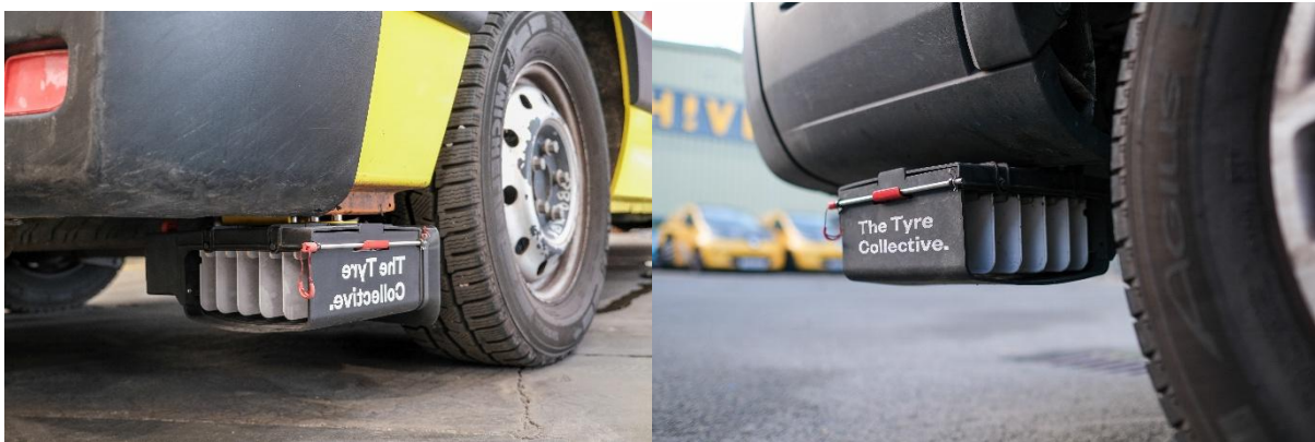
Figur 2. Uppsamlingsanordning (prototyp) från The Tyre Collective som samlar upp däckslitagepartiklar under färd med hjälp av elektrostatisk kraft. Foton: The Tyre Collective. (Publicerade med tillstånd från The Tyre Collective, 2025.)

I början av 2020-talet uppfann en grupp studenter på Imperial College i London en prototyp för att fånga upp däckpartiklar från fordon vid färd (Wilson, 2020). Prototypen är en enkel anordning som fästs vid hjulhuset och använder elektrostatisk kraft för att samla partiklarna för att minska deras spridning i miljön, se Figur 2. Enligt uppfinnarna kan prototypen samla upp 60 procent av alla luftburna partiklar från däck under kontrollerade förhållanden. Dock krävs mer studier för att utvärdera metoden under verkliga förhållanden och ytterligare utveckling för att föra ut produkten på marknaden (Johannesson & Lithner, 2021).