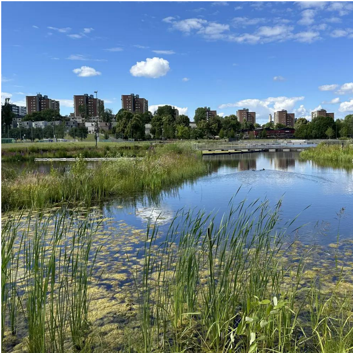
Figur 6. Exempel på dagvattendamm.