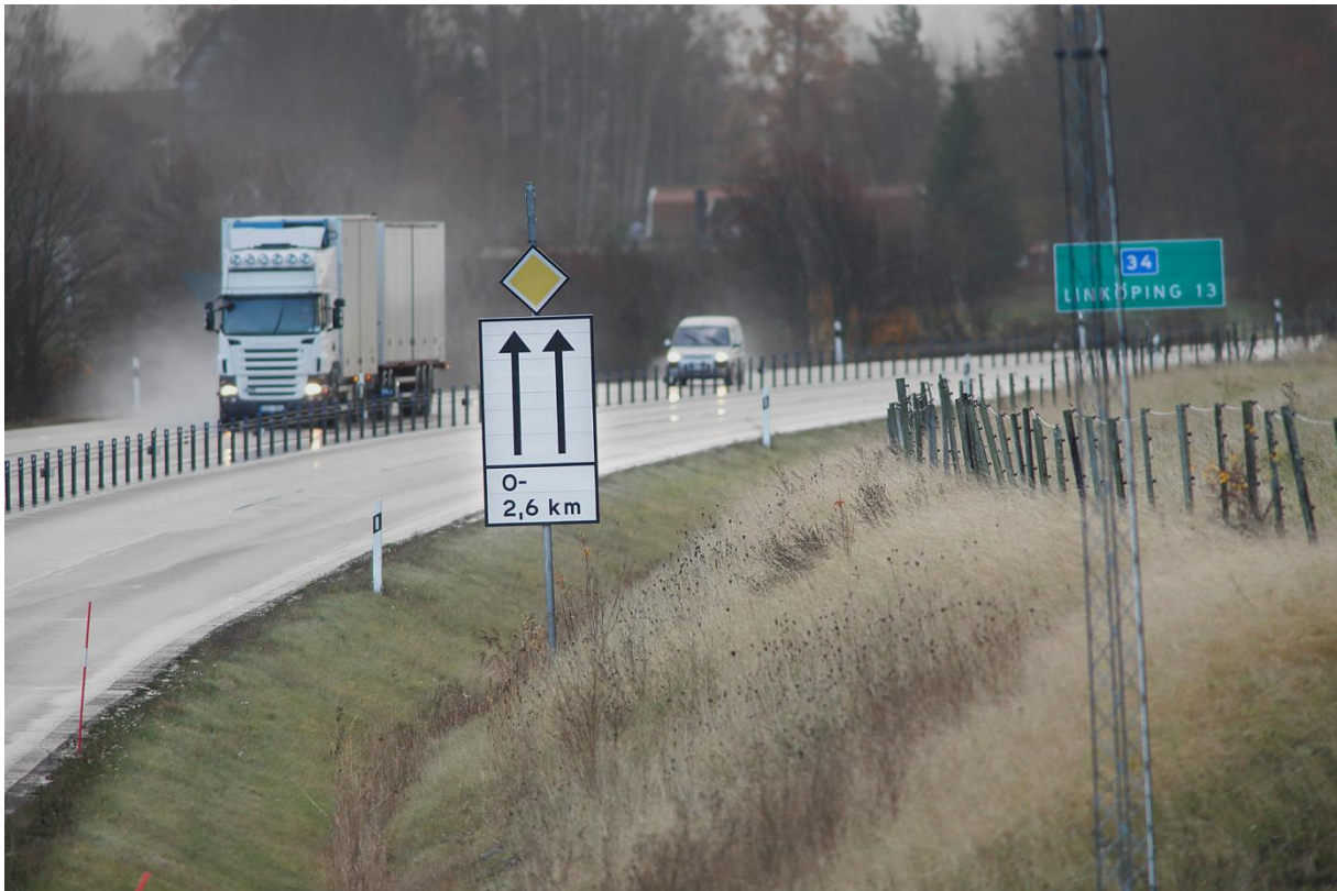
Figur 5. Vägdike längs Riksväg 34, Sverige.

Provtagningar av dikesjord invid motorvägssträckan Västerås-Enköping har visat att däckpartiklar förekommer både i dikesslätten närmast vägen och i dikesbotten (Polukarova m.fl., 2025a). De högsta halterna återfanns nära vägkanten, medan lägre halter uppmättes i dikesbotten. Däckpartiklar uppmättes dessutom i jordlager ned till 0,5 m, vilket sannolikt beror på transport via sprickor som bildats vid torka och genom rotkanaler. I en norsk studie visade resultaten att halterna av däckpartiklar i vägdiken inte varierade med avståndet från vägen (0–6 m) (Rødland m.fl., 2023). Fastläggningskapaciteten kan således variera mellan olika diken och kan bero på flera faktorer.