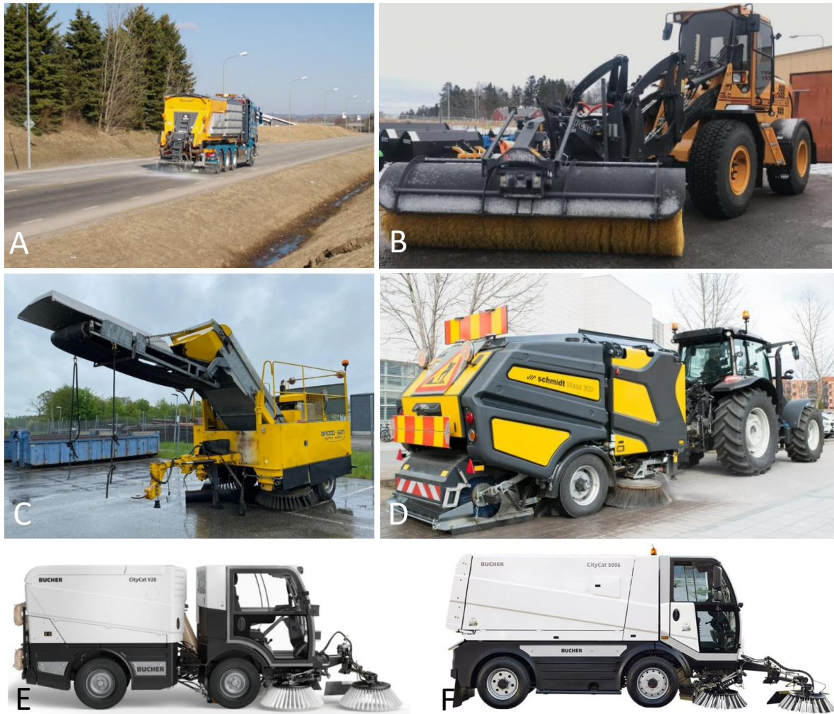
Figur 3. A) Saltspridare B) hjullastare med borste, C) lastbilsdragen elevator, D) traktordragen elevator, E) liten vakuummaskin (Citycat v20), F) stor vakuummaskin (Citycat 5006) (från Gustafsson m.fl., 2023).

Dessutom togs prover från den uppsopade sanden och en bedömning av mängd borstförbrukning genomfördes. Studien visade att båda städmaskinerna minskar mängden mikroplast på vägytan, men endast elevatormaskinen reducerade även de plastrelaterade polymererna. Den procentuella effekten på gummipolymerer var högre för vakuummaskinen vilket delvis beror på en initialt större mängd damm på ytan där vakuummaskinen provades. De mest förekommande polymererna på vägytan var polypropylen, PVC och polyeten. De gummirelaterade polymererna, polyisopren och polybutadien, utgjorde mellan 8 och 37 procent av den totala analyserade mängden polymerer. Mängden gummirelaterade polymerer var alltså lägre än övriga plastpolymerer, vilket sannolikt beror på att den använda analysmetoden underskattar gummipolymerer (partiklar i storleksintervallet 27–1000 \mu\text{m} analyserades). Under vårsopningen framgick dock att mängden polypropylen (den vanligaste plasten i borstarna) ökar på vägytan. Fördelningen av de mikroplaster som analyserats skiljde sig markant mellan vägytan och det material som maskinerna samlat in. Detta bedömdes bero på att maskinerna huvudsakligen samlar in grövre fraktioner, medan finare fraktioner blir kvar på vägytan (Gustafsson m.fl., 2023).