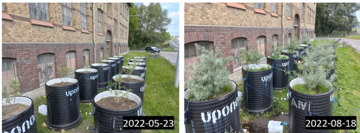
Figur 7. Pilotanläggning för att utvärdera funktion och processer i bioretentionsfilter med tillsatts av sorbentmaterial. (från Johansson, m.fl. 2024).

I en nyligen utförd studie konstruerades 13 bioretentionsfilter i en pilotanläggning för att utvärdera hur dessa filter kan rena förorenat dagvatten. Avrinning från en motorväg och angränsande hårdgjorda ytor som hade försedimenterat i en kammare användes för bevattning av filtren (Johansson m.fl., 2024). I tio av filtren planterades en kombination utvalda växtarter: Trift ( Armeria maritima ), Havtorn ( Hippophae rhamnoides ), Veketåg ( Juncus effusus ) och Rödsvingel ( Festuca rubra ), se Figur 7.