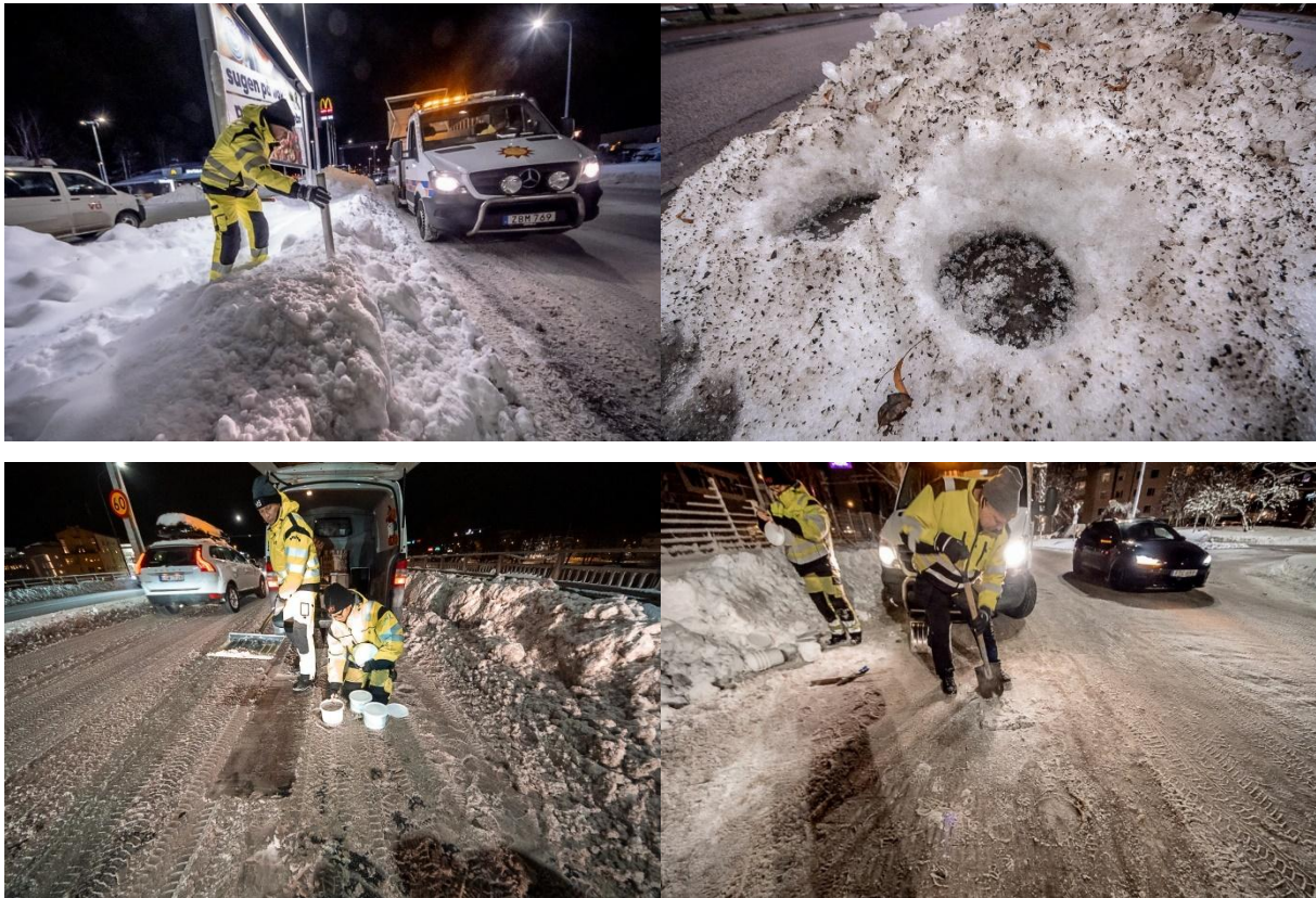
Figur 4. Provtagning av olika snötyper på och runt gator i Karlstad (från Blomqvist m.fl. 2023)

plogkant jämfört med de halter som uppmättes i själva plogvallen (Blomqvist m.fl., 2023). Snö i vägnära miljöer innehåller också höga halter av metaller (Vijayan m.fl., 2024) och olika typer av organiska föroreningar (Björklund m.fl., 2011).