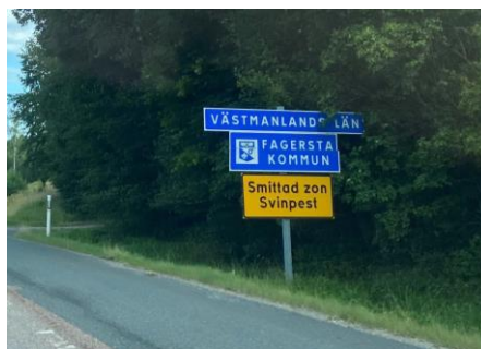
Skylt vid riksväg 66

Ett stort tack riktas till alla som bidragit i arbetet med Trafikverkets hantering av afrikansk svinpest.