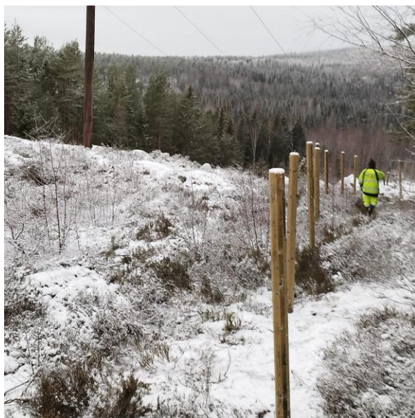
Stängsling runt kärnområdet

Kostnaden som Trafikverket har fakturerat Statens jordbruksverk är 41 407 804 kr.