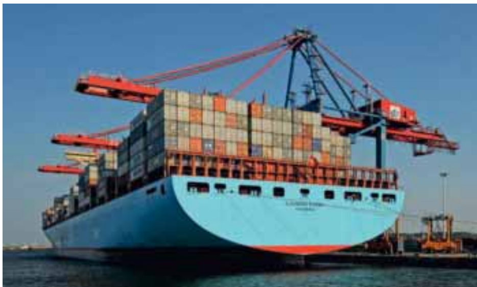
Maersk Line anlöper nu Göteborgs hamn med sina största containerfartyg. Hamnen får besök varje tisdag.

Kryssningstrafikens utveckling är ett exempel på Göteborgs attraktivitet som turistmagnet. I år slås nytt rekord när 51 kryssningsfartyg anlöder hamnen med 64 000 passagerare ombord, vilket kan jämföras med fem besök 2002. Engelsmän, tyskar och amerikaner är de vanligaste gästerna. Den genomsnittlige turistens spenderar 900 kronor på en dag, vilket innebär att kryssningstrafiken i år genererar 57 miljoner kronor i intäkter till staden.