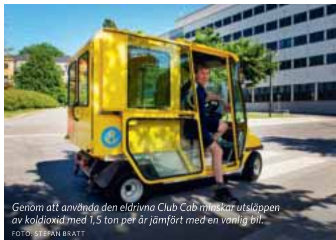
Genom att använda den eldrivna Club Cab minskar utsläppen av koldioxid med 1,5 ton per år jämfört med en vanlig bil.

”I grund och botten handlar det om att göra mer av det vi redan gör i dag: fler elfordon i brevbäringen, ökad andel biodrivmedel och ökad fyllnadsgrad i lastbilarna för att nämna några exempel.”