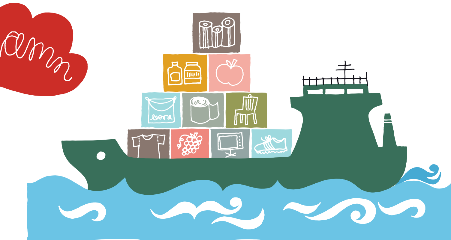
ILLUSTRATION: SUSANNE ENGMAN