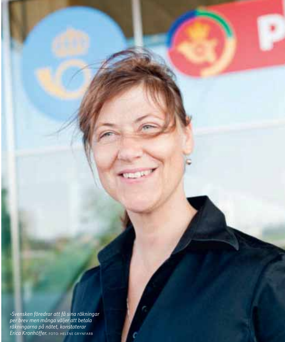
-Svensken föredrar att få sina räkningar per brev men många väljer att betala räkningarna på nätet, konstaterar Erica Kronhöffer.