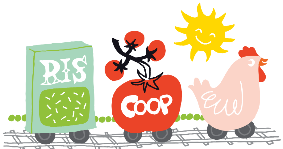
ILLUSTRATION: SUSANNE ENGMAN

IORE-loken är energieffektiva och har inbyggd energiåtermatning.