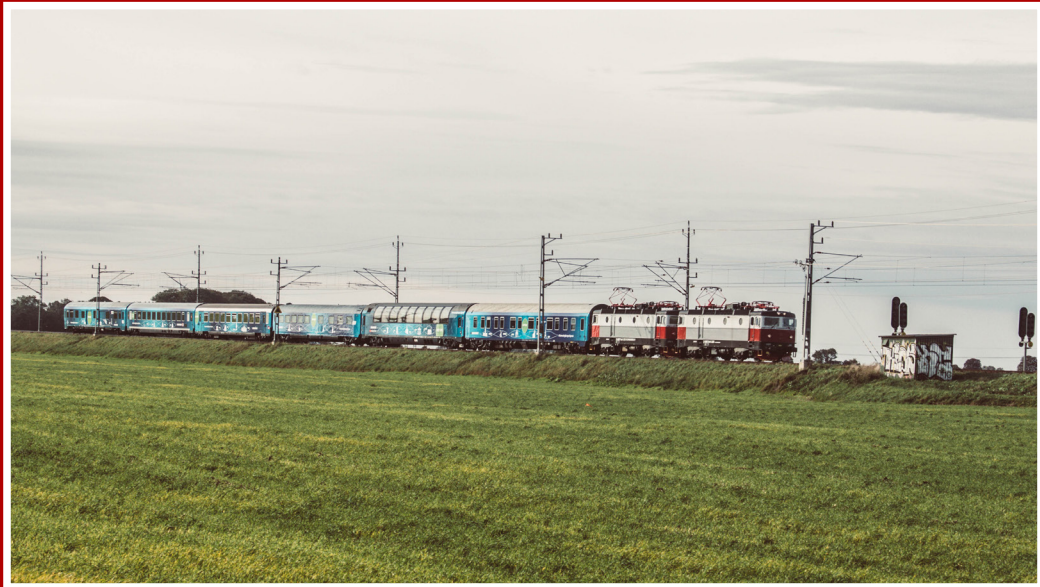
Connecting Europe Express tåget i Sverige, foto Ossian Olsson, Trafikverket.