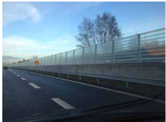
Bulleråtgärder är ett nationellt projekt där vi runt om i hela landet arbetar med att minska bullret längs med järnväg och statligt ägda vägar.

Bulleråtgärder längs väg och järnväg är ett nationellt projekt där vi arbetar med att minska bullret längs med järnvägen och de statligt ägda vägarna. Åtgärderna gör vi vid befintlig väg och järnväg, men också vid nybyggnation eller större ombyggnader. Trafikverkets övergripande strategi är att minska bullret från väg eller järnväg, men vi gör också bullerskyddande åtgärder vid sidan av, exempelvis fönsterbyten.