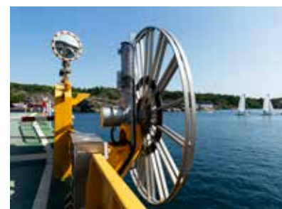
Kanske var det Annie på Lyrleden som inspirerade linfärjan på Oaxen att också gå över till el.

Nu har linfärjan på sträckan Oaxen-Mörkö i Södertälje, försetts med eldrift. Färjan drivs av Oaxens samfällighetsförening med stöd av statsbidrag via Trafikverket. ↓