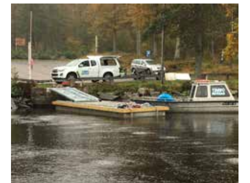
Den nya bryggan är betydligt säkrare än den gamla.

- Det var ett bra samarbete mellan leverantören och ledpersonalen. Nu finns det en ny brygga som är säkrare än den gamla, med halkfri durkplåt och räcken på landgångarna, säger Jim. ♡