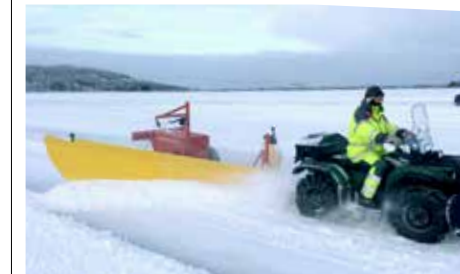
Här plogas snön bort på Bohedenleden för att göra isväg.

- Isen la sig väldigt snabbt i älven. Det innebär att vi inte kunde arbeta med isvägen samtidigt som färjan var i drift och det blev ett uppehåll utan någon överfart under cirka två veckor. Normalt brukar det variera mellan inget stopp upp till max en vecka de senaste åren, säger distriktchef Roger Olofsson. Även på Bohedenleden förväntas isvägen öppna inom kort. ↓