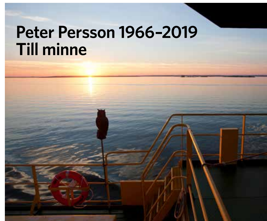
Aspöleden.