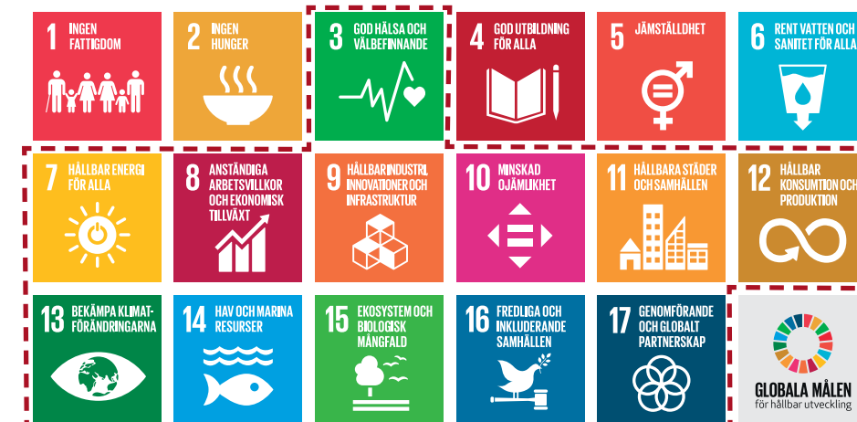
Transportsystemet kan bidra till 11 av Agenda 2030-målen för ett hållbart samhälle.