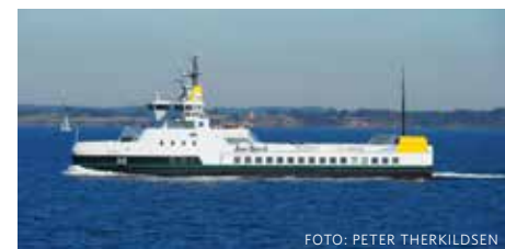
Danska färjan Ellen drivs helt med el.

Ellen är en 100 procent eldriven färja och hon ingår i det danska projektet E-ferrys. Det stöds av en statlig stiftelse och av EU-kommissionens "Horizon 2020". ↓